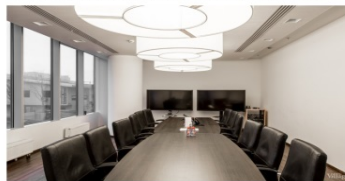
Мини конференц - зал на 8-10 человек

Концепция Техно-парка с высокотехнологичным производством (коворкинг центр, бизнес инкубаторы, лаборатории) г. Уфа